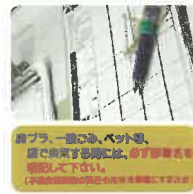
ごみ排出者の明示