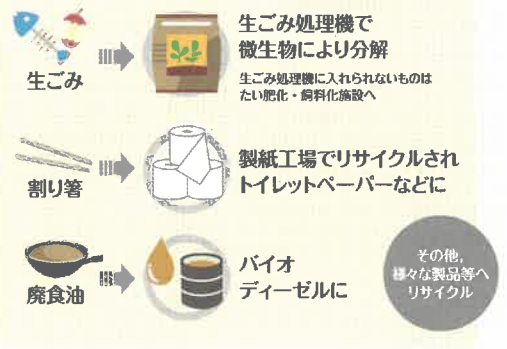
ごみの減量化やリサイクルの取組