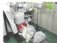
ごみの計測・記録

「見える化」に取り組むことで、ごみ量やリサイクル量などがわかり、社員のやる気にもつながります。多い時では、前年比4割減になった月もあり、成果を実感しています。ごみの減量は社会貢献の一つ。事実とデータを検証し、ごみを減らせるよう、取り組んでいます。